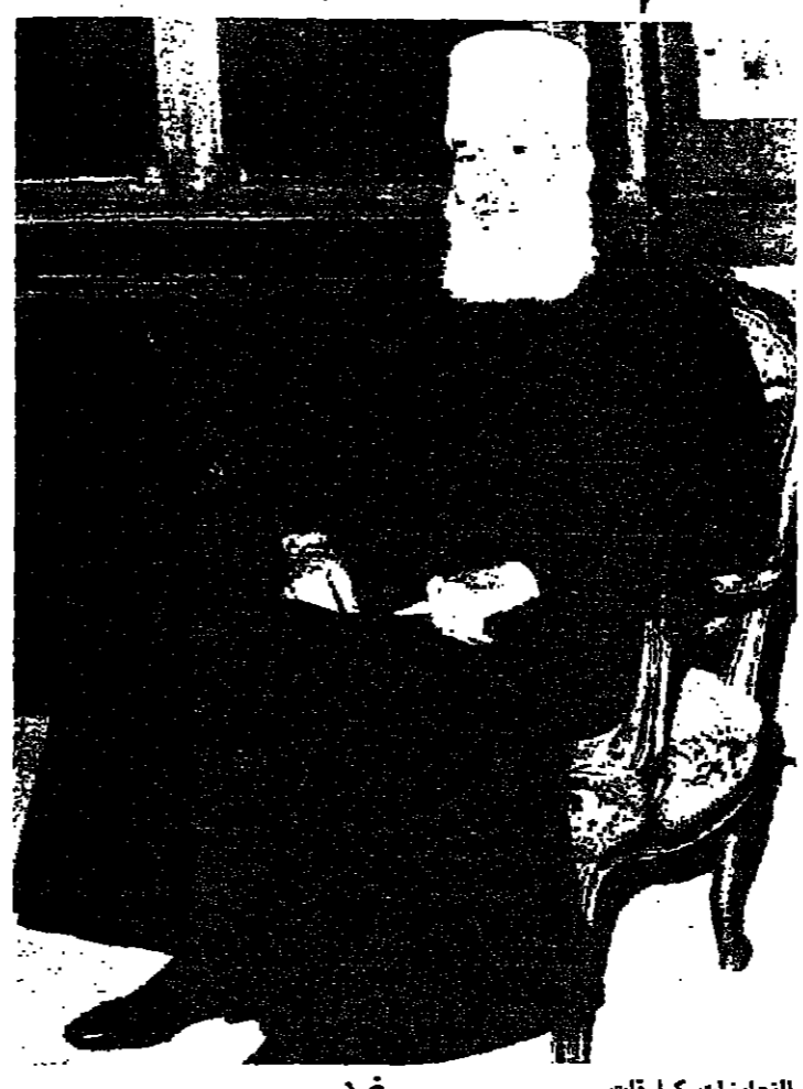
التجارات كما قلت .. تتجلى التجارات كيف ينسج برايمك ..؟

في سلسلة للآراء مع الشخصيات اللبنانية ، نشرت صحيفة « البعث » السورية أمس حديثاً لساحة الشيخ محمد أبو شقرا شيخ عقل الطائفة الدرزية ، تحدث فيه عن أسباب الازمة ، وعن النجدة العربية السورية لاتحاد لبنان ، وشمل الحديث الطائفية والعلمنة والوفاء السياسي . وفيما يلي الحديث :